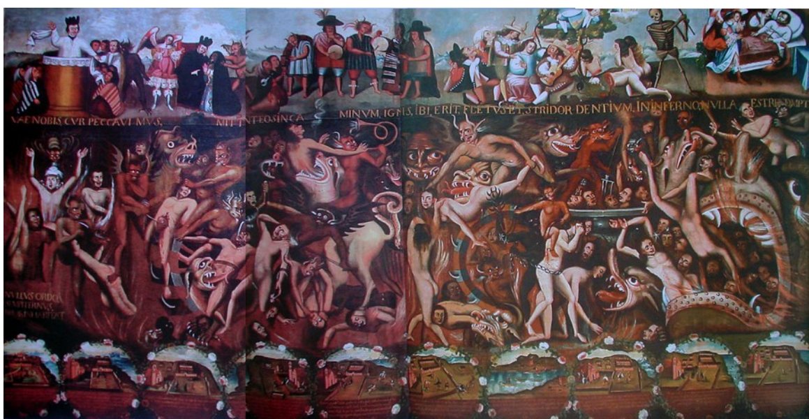
La iglesia de Andahuaylillas (c. 1626, Cuzco)

condenados; siete monstruos devoradores, como multiplicaciones de la gran boca infernal del extremo derecho, desgarran y fagocitan a las figuras desnudas de los pecadores; otros diablos encadenan, agreden y arrancan cabelleras. En la parte central del friso, una gran cabeza demoníaca en posición frontal y de aspecto terrible parece interpelar al espectador; la rueda giratoria, tridentes, garfios, mazas y horquillas son los instrumentos de tortura. Hacia la zona derecha de la composición, se percibe un caldero hirviente repleto de almas, más animales devoradores y la gran boca infernal a la que son arrojados violentamente los condenados; la posición de los cuerpos enfatiza la noción de caída en el orificio engullidor y flamígero.